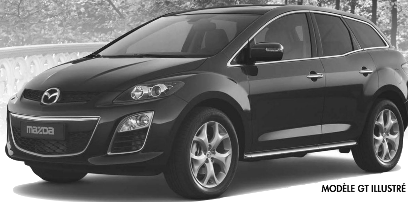
MODÈLE GT ILLUSTRÉ

27995$ Transport et préparation inclus. Taxe pour climatiseur inclus.