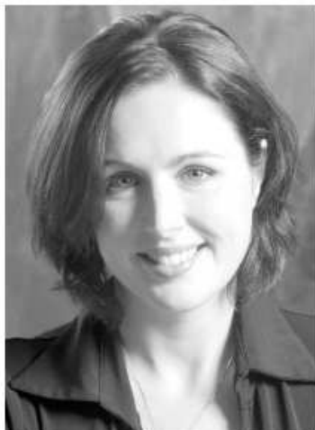
La soprano Caroline Bleau vous en mettra plein... les oreilles.