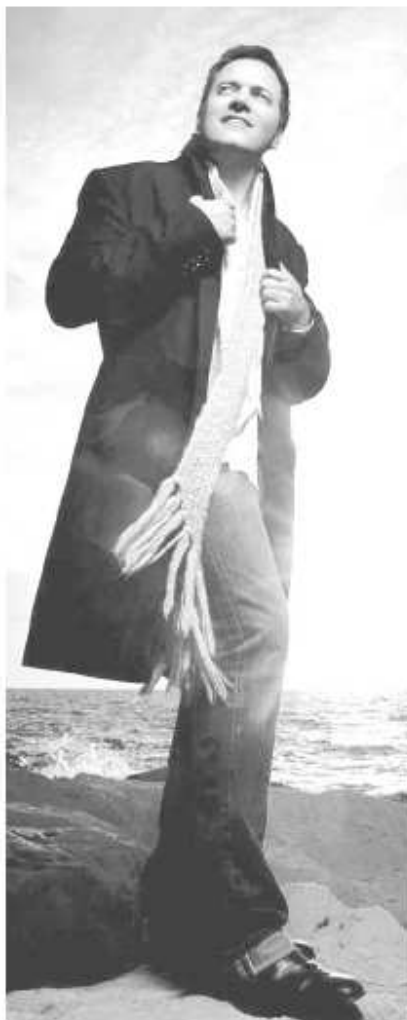
Mario Pelchat sera parmi les artistes invités pour cet important événement.

L'événement 100 % Terrebonne aura lieu au Collège Saint-Sacrement de Terrebonne le samedi 29 novembre à 19 h. Vous pouvez vous procurer les billets au coût de 15 $ chacun, au bureau du Gala du Griffon d'Or, situé au 160 Saint-André dans le Vieux-Terrebonne. Pour obtenir de plus amples informations, vous pouvez contacter l'organisation au 450 471-0033.